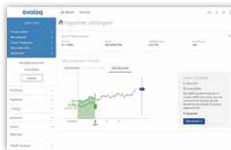
Beispiel: kw Advisory Suite integriert ins Avaloq e-Banking

erlebnis verwandeln. Interaktive graphische Simulation verschiedener Szenarien helfen dem Kunden bei der Entscheidungsfindung.